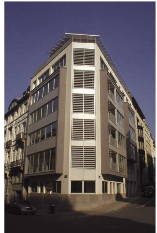
Association Révolution Brussel