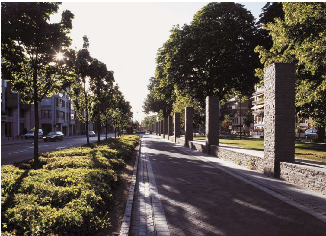
Groene Boulevard, Hasselt