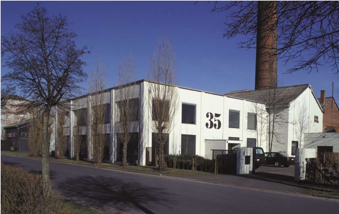
Kantoren De Gregorio & Partners